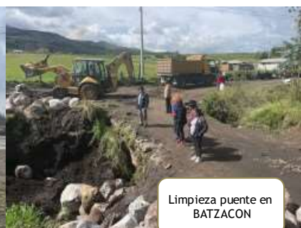
Limpieza puente en BATZACON