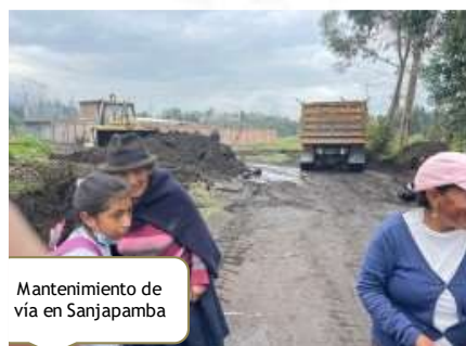
Mantenimiento de vía en Sanjapamba

Se ofició al GAD Provincial para mantenimiento de las vías comunitarias, pero cabe mencionar el cronograma no se ejecutó al 100% por la disponibilidad de maquinaria para las fechas prevista.