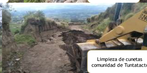
Limpieza de cunetas comunidad de Tuntatacto