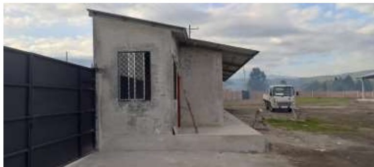
FOTO FABRICA DE ADOQUINES

Queda pendiente la instalación de maquinaria por parte del concejo provincial para que sea operativa y empezar la producción