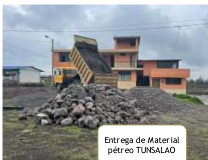
Entrega de Material pétreo TUNSALAO