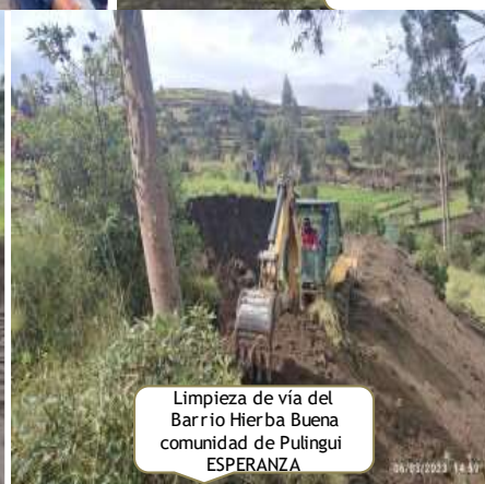
Limpieza de vía del Barrio Hierba Buena comunidad de Pulingui ESPERANZA